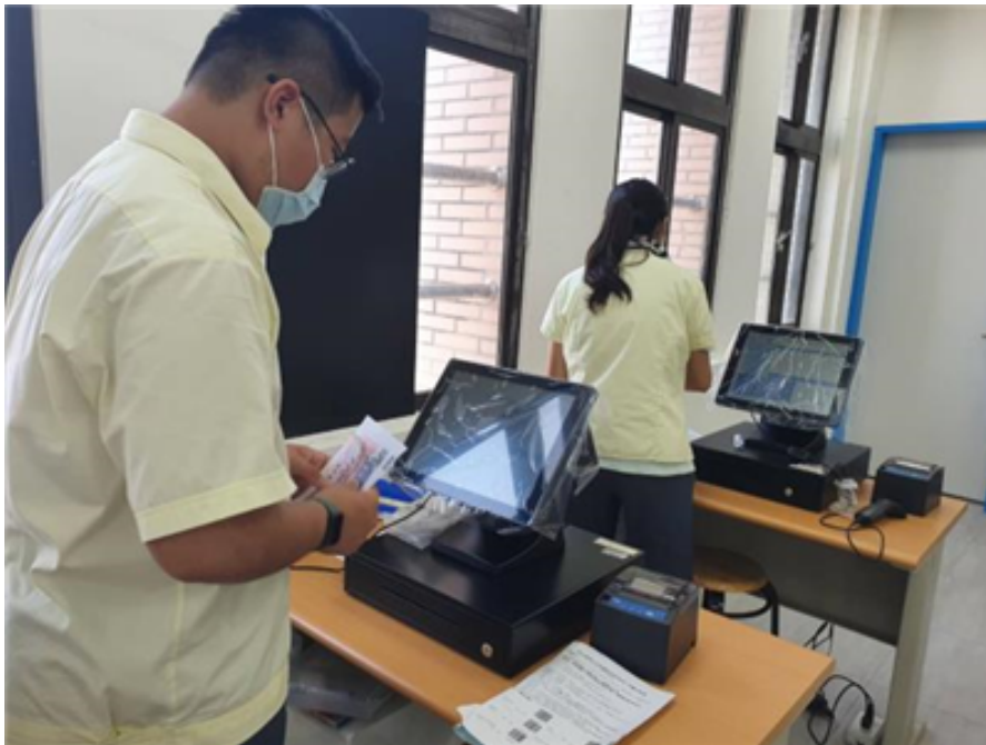
商業經營科/門市經營實務/一體成形POS主機含8吋背掛式螢幕