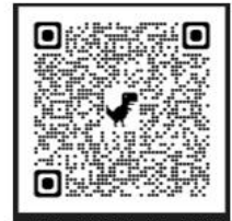
愛心便當/新生制服/ 工讀生申請表

(4)若有填寫疑問，請電洽訓育組，分機 1310；新生制服費減免申請疑問請電洽生輔組長，分機 1320。愛心便當申請疑問請洽午餐秘書，分機 1312、1224。