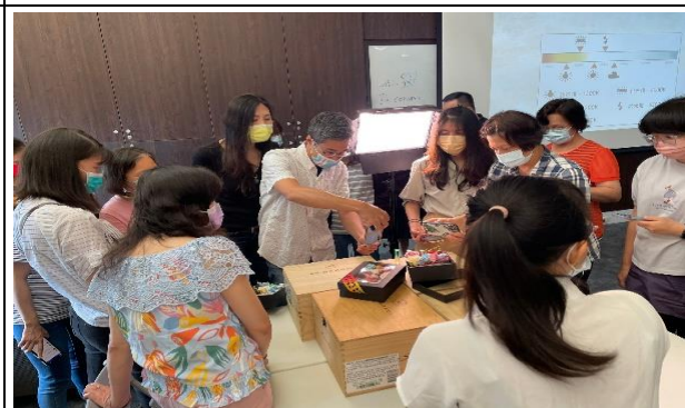
創意商品攝影實務