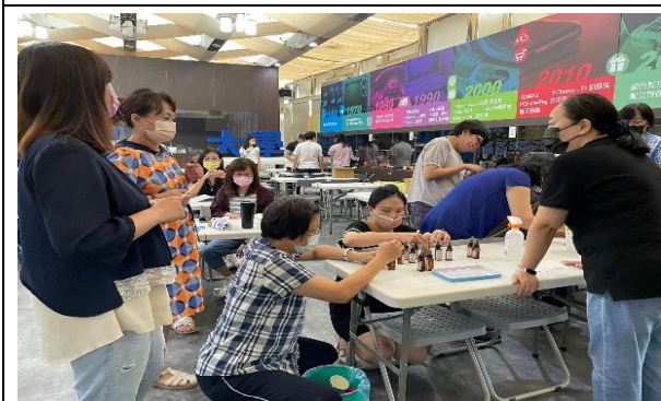
創意商品實作-擴香精油