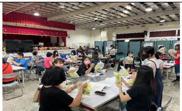
在地農產品實作-玉米筍泡菜