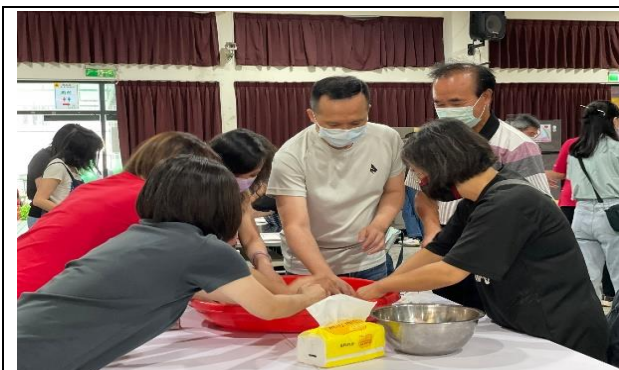
在地農產品實作-糖漬火龍果皮