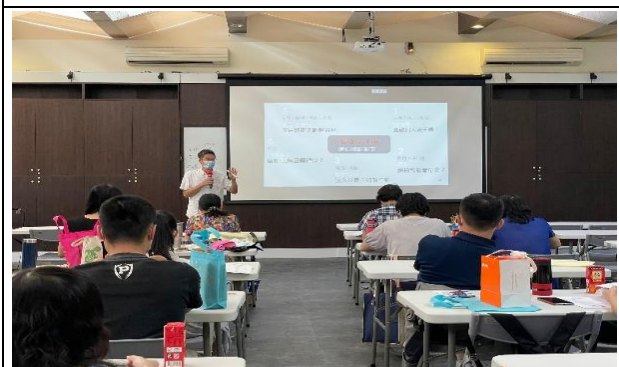
創意商品影音行銷