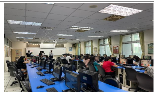
智慧零售發展與趨勢