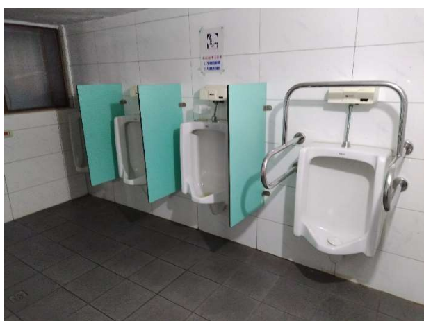
說明：無障礙廁所照片_信義樓 2