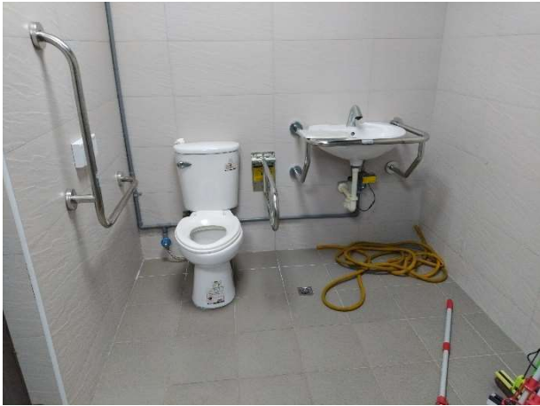
說明：無障礙廁所照片_游藝館 1