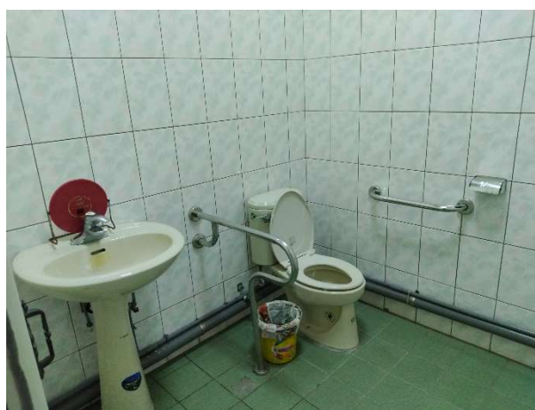
說明：無障礙廁所照片_崇清村