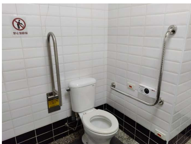
說明：無障礙廁所照片_忠孝樓