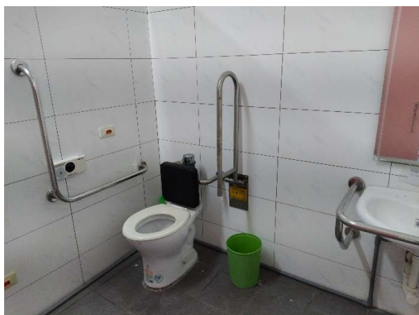
說明：無障礙廁所照片_仁愛樓