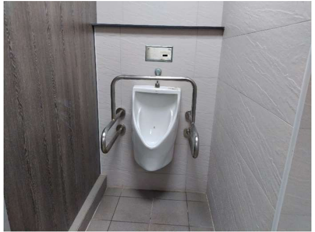
說明：無障礙廁所照片_游藝館 2