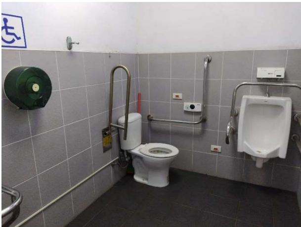
說明：無障礙廁所照片_圖書館