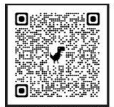
愛心便當/新生制服/ 工讀生申請表

(4)若有填寫疑問，請電洽訓育組，分機 1310；新生制服費減免申請疑問請電洽生輔組長，分機 1320。